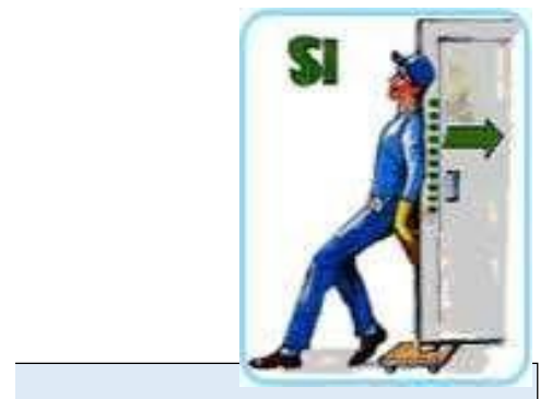
Per ridurre il rischio di esposizione