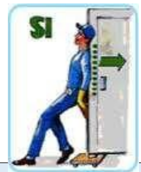
Per ridurre il rischio di esposizione