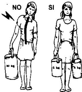
BILANCIARE SEMPRE I CARICHI